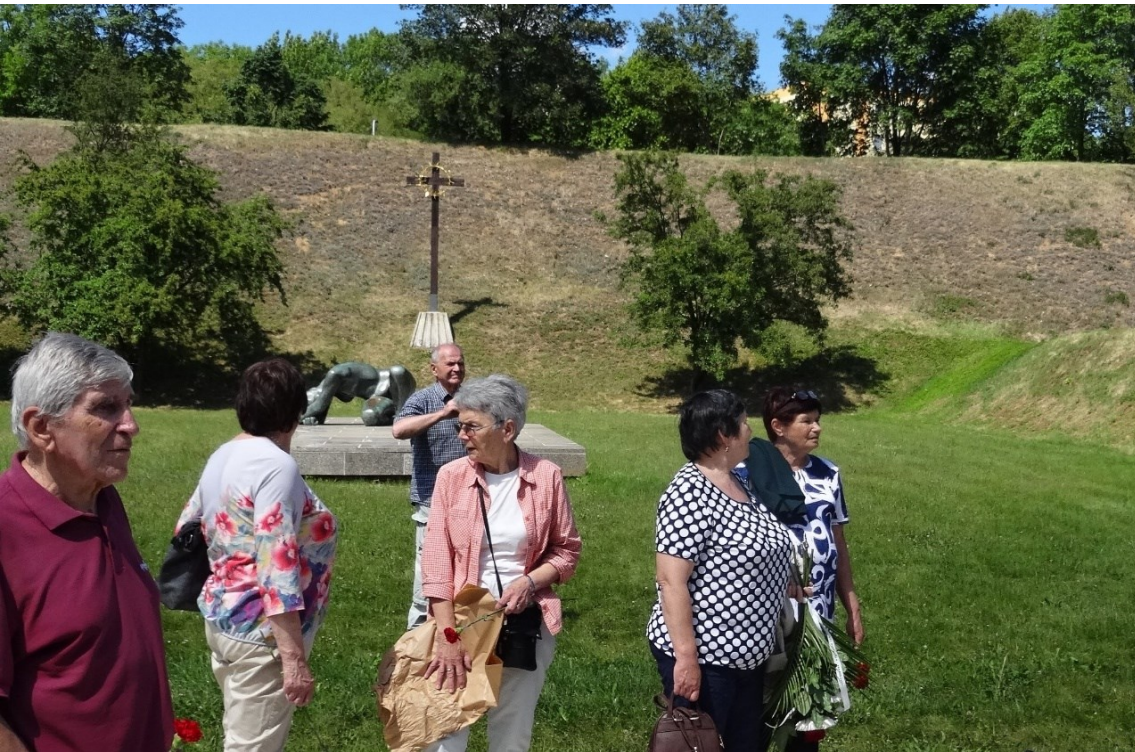
Na Kobyliské střelnici v Praze.