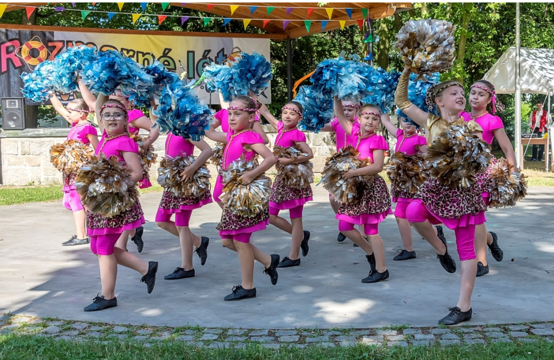
Vystoupení mažoretek Zara 3.