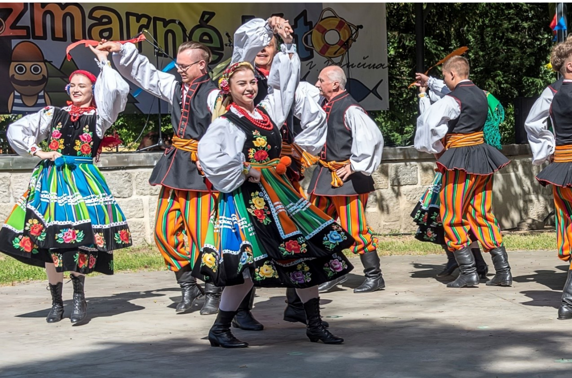
Tanečníci z polské Ratiboře.