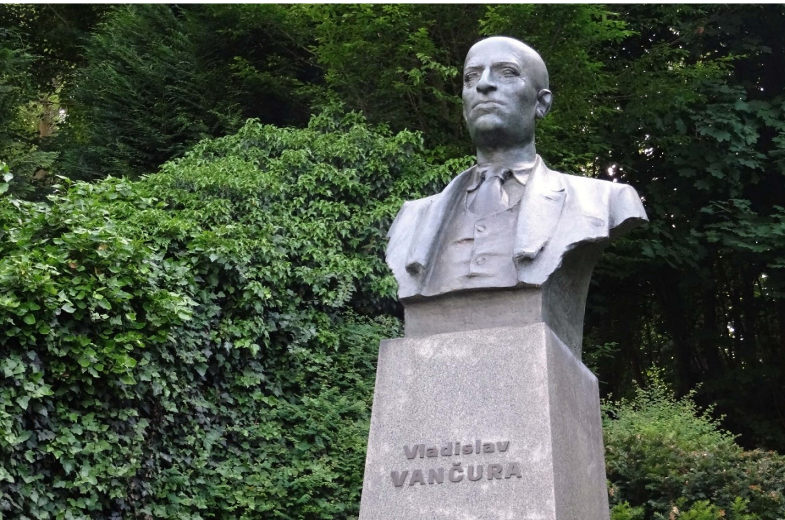
Pomník Vladislava Vančury na Zbraslavi.