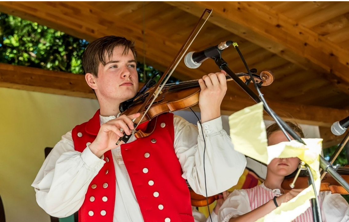
Mladý primáš cimbálové muziky ZUŠ Vladislava Vančury.