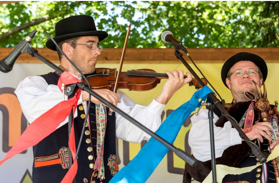
Z vystoupení dudácké muziky na Rozmarném létě.