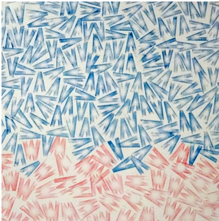
Grafika Johana Hašková