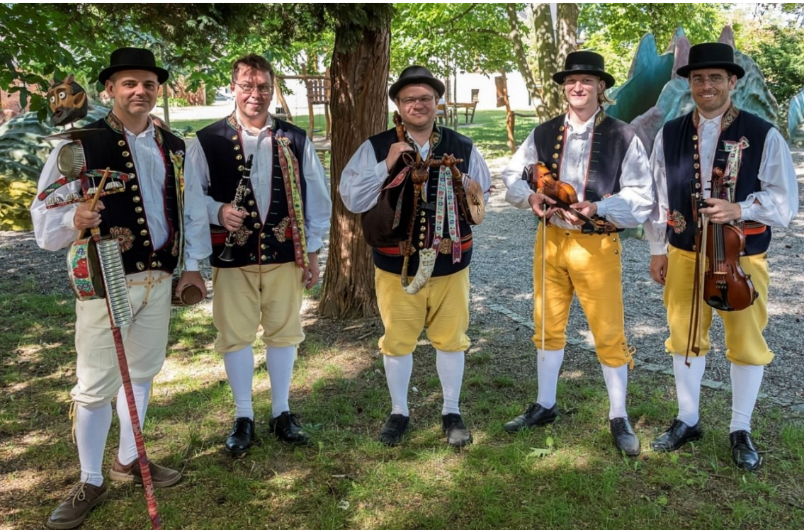
Domažlická dudácká muzika na slavnosti v Dohnálkově parku.