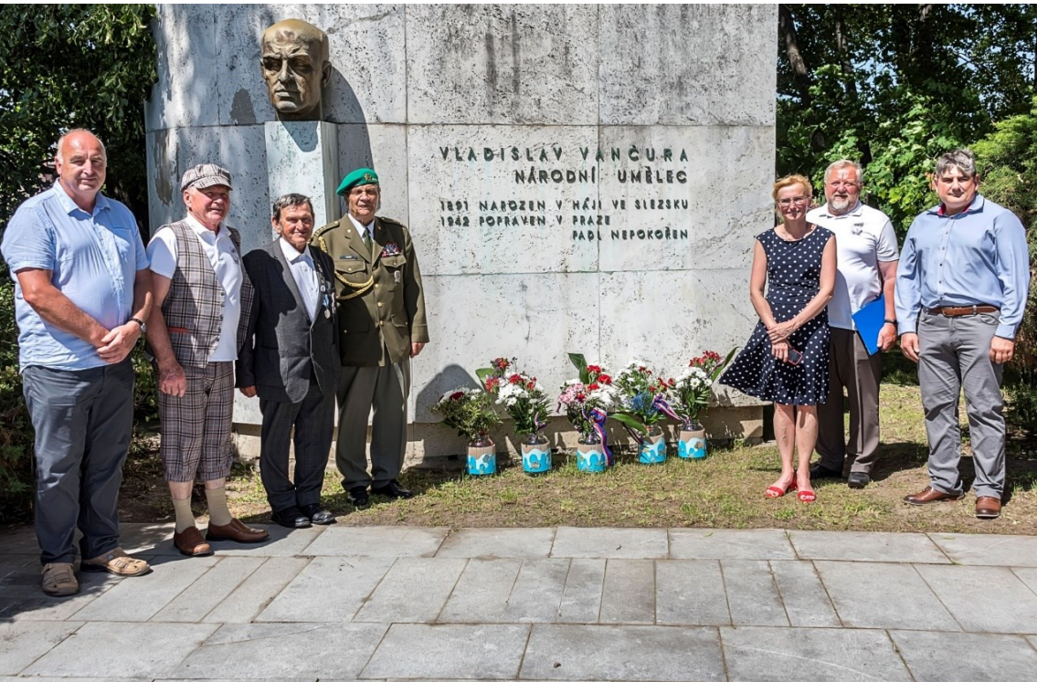
Hosté Rozmarného léta u Vančurova pomníku v Háji ve Slezsku.