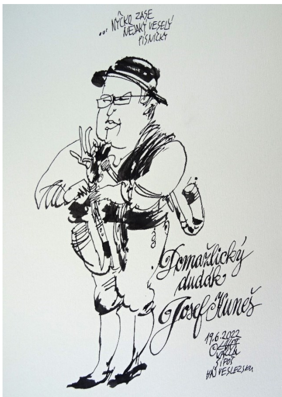
Kresba Václav Šipoš